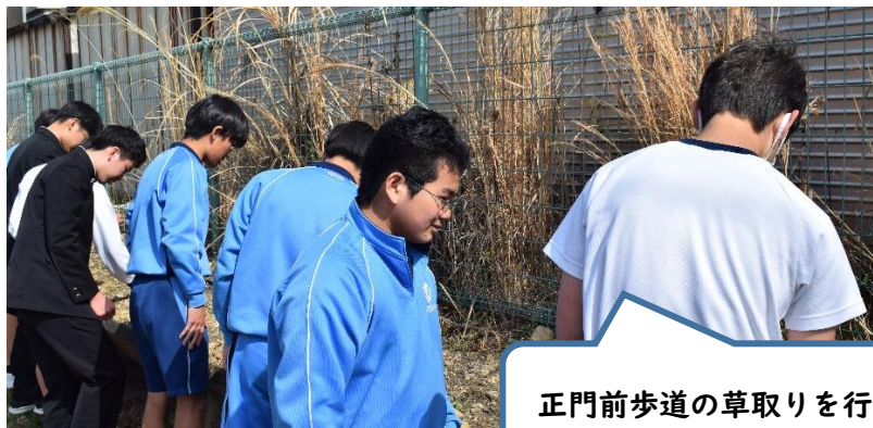
正門前歩道の草取りを行いました。