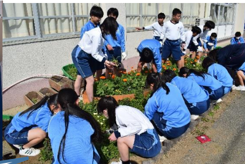
写真は無いですが音楽準備室の片付けを行いました。