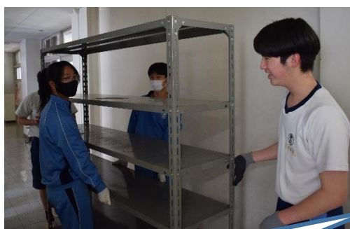
進路関係掲示板をきれいにしました。