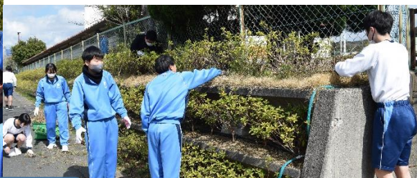
教頭先生の仕事のお手伝いをしました。