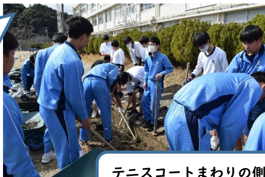
テニスコートまわりの側溝の土出し行いました。