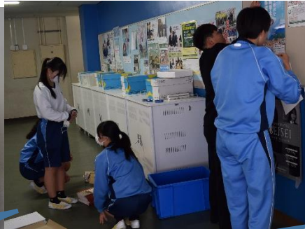
花壇の草取りを行いました。