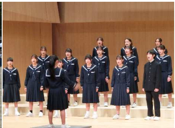
南風祭合唱の部@磐田市民文化会館かたりあ