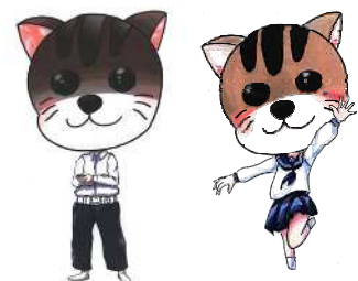
袋井南中キャラクター にゃんちゅう