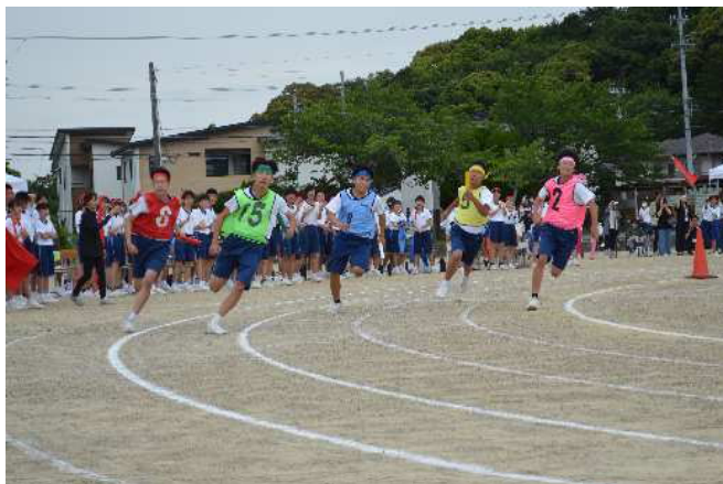
南風祭体育の部@本校グラウンド

このモザイクアートは、南の丘学園の小中学校のリーダーたちが、学園の笑顔をつくる方法をリーダーミーティングで繰り返し話し合い、南の丘学園のみんなの「笑顔」をたくさん集めて作成しました。