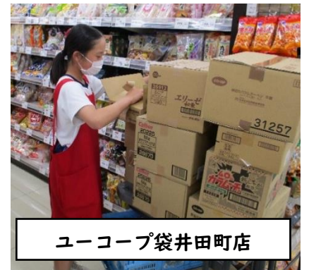
ユーコープ袋井田町店