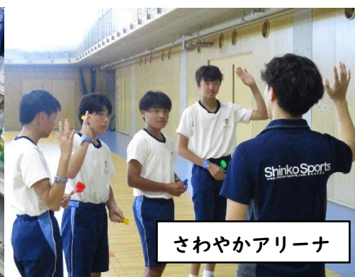
さわやかアリーナ