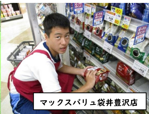
マックスバリュ袋井豊沢店