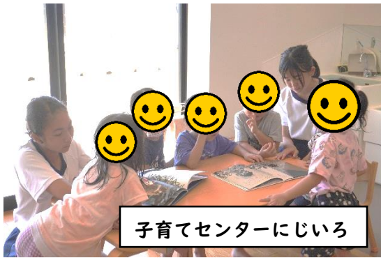
子育てセンターにじいろ