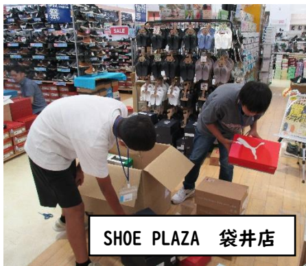
SHOE PLAZA 袋井店