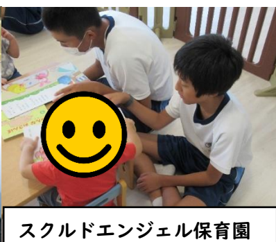
スクルドエンジェル保育園