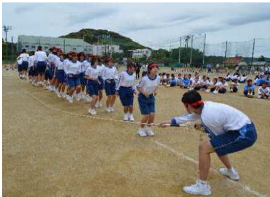
南風祭体育の部@本校グラウンド

このモザイクアートは、南の丘学園の小中学校のリーダーたちが、学園の笑顔をつくる方法をリーダーミーティングで繰り返し話し合い、南の丘学園のみんなの「笑顔」をたくさん集めて作成しました。