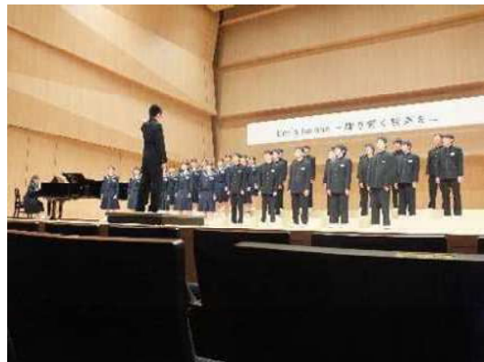
南風祭合唱の部@磐田市民文化会館かたりあ