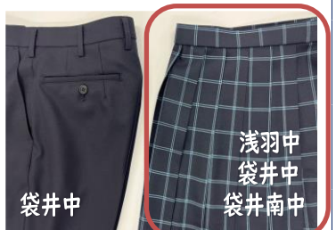
C案 紺色・チェック柄