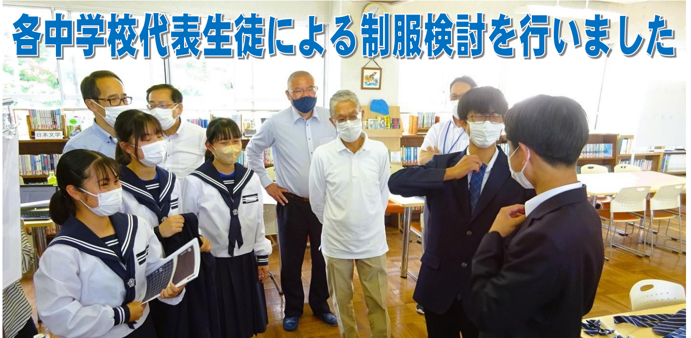
【5月26日(金) 学校運営協議会での代表生徒による制服検討の様子 @袋井南中学校】

袋井市内4中学校（浅羽中・周南中・袋井中・袋井南中）の代表生徒の皆さんが、マスターメーカーの説明を聞いて、袋井市内4中学校新制服モデルについて話し合いを行いました。今回はその結果、代表生徒の皆さんが選んだ新制服のデザインをお知らせします。