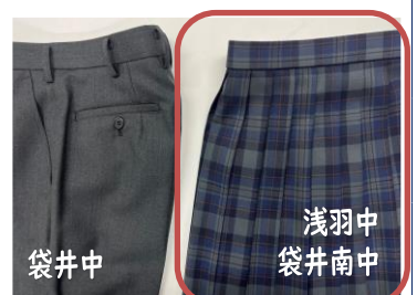
A案 グレー・チェック柄