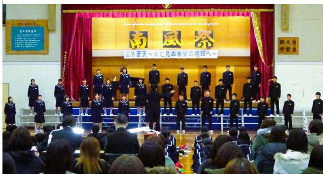
2年生の合唱の様子