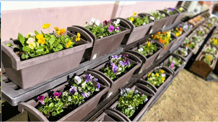
きれいに植えられたプランターの様子

第4弾の寄せ植えユニット「よせよせ隊」の皆さんは、卒業式や入学式に花を添えるプランターづくりにチャレンジしました。午後の少し肌寒い時間でしたが、わずか30分くらいで50個くらいの寄せ植えをみんなで作ってくれました。これから美しい花が育っていくのが今から楽しみです。このように、袋井南中学校の生徒たちの主体性が高まってきていることが感じられる充実の2学期でした。