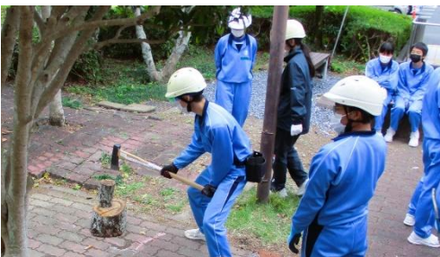
薪割りユニット「薪割りたい?…」