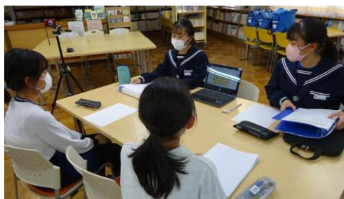
南の丘学園リーダーミーティング

第3弾の新交通安全ユニット「 交通ルールを守ろうYo! 」は、地域の交通安全運動に参加し、広愛大橋からセブンイレブンのある交差点までを、交通安全を呼び掛けて、歩く活動を寒い中でも負けず、意欲的に行いました。1年生が初めてユニットリーダーに挑戦しました。