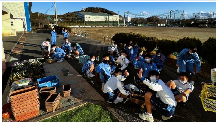
寄せ植えユニット「よせよせ隊」の皆さん