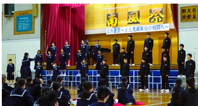
1年生の合唱の様子

また、多くの保護者の皆様が、子供たちの合唱の様子を実際に参観するため、駆け付けていただきました。今年度は、学校公開日や参観会が中止になったことも多く、直接子供たちの様子を見ていただく機会が少なくなったこともあり、貴重な参観会となりました。