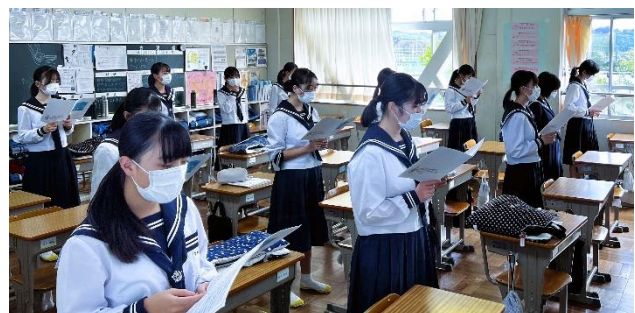
【各学級でのパート練習の様子】