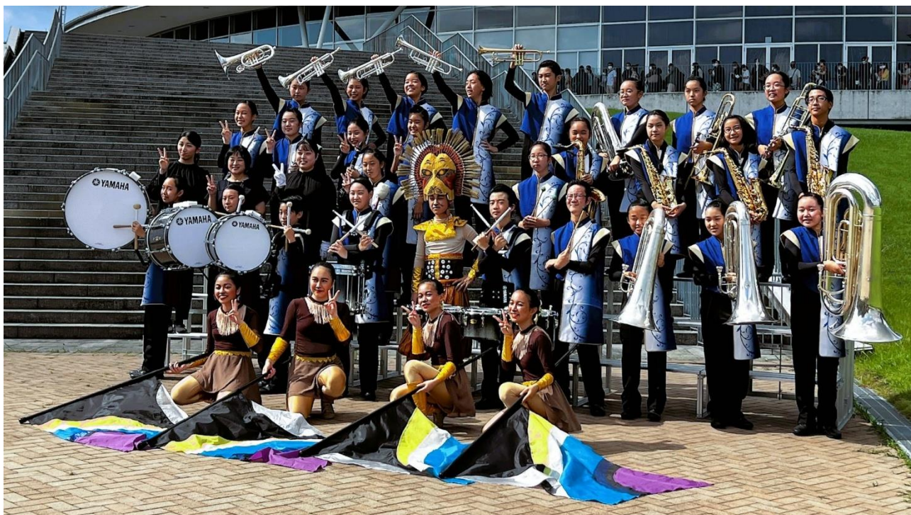
【マーチングバンド静岡県大会で金賞と朝日新聞社賞を受賞した袋井南中吹奏楽部South Dream】

10月30日(日)に愛知県名古屋市にある日本ガイシホールで開催された「第48回マーチングバンド東海大会」において、本校吹奏楽部「South Dream」が今年度も出場し、銀賞を受賞しました。『THE LION KING』を演技演奏し、観衆を魅了しました。