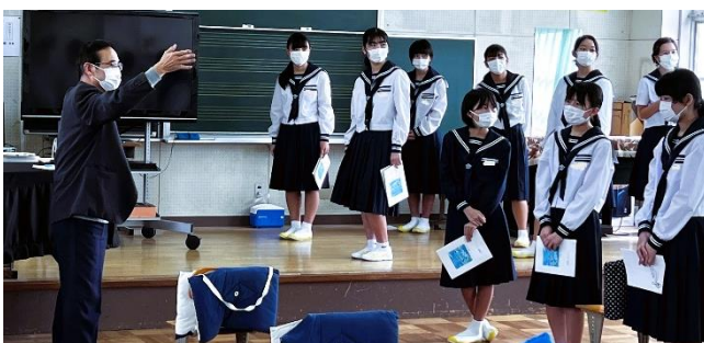
【古山先生による3年生への事前の合唱指導】