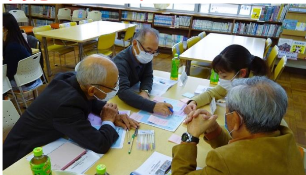
【熱心にワークショップで熟議する委員の皆様】

協議の中では、学園の子供たちに育みたい資質・能力や今後の支援の方策について話し合っていました。お忙しい中、運営協議会に参加していただき、本当にありがとうございました。いただいた貴重な御意見を、今後の学園の教育活動に生かしていきます。